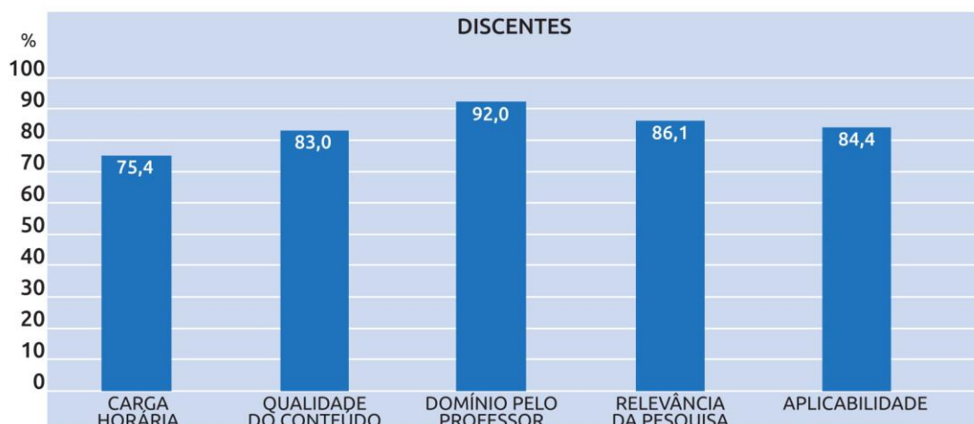
Gráfico 3 - Percentual de avaliações positivas (Bom/Muito bom) na dimensão "Conteúdo e Aplicações" dos Minicursos

Em resumo, os resultados da pesquisa apresentados reiteram os bons índices mediante a classificação do 28º Encontro de Iniciação Científica pelos participantes. As apresentações dos trabalhos e os minicursos têm sido eficazes e eficientes naquilo que se propõem: tornar o conhecimento técnico-científico, no que tange a pesquisa acadêmica, cada vez mais acessível aos estudantes e divulgar para o meio acadêmico as pesquisas realizadas nos diversos Campi da UFS.