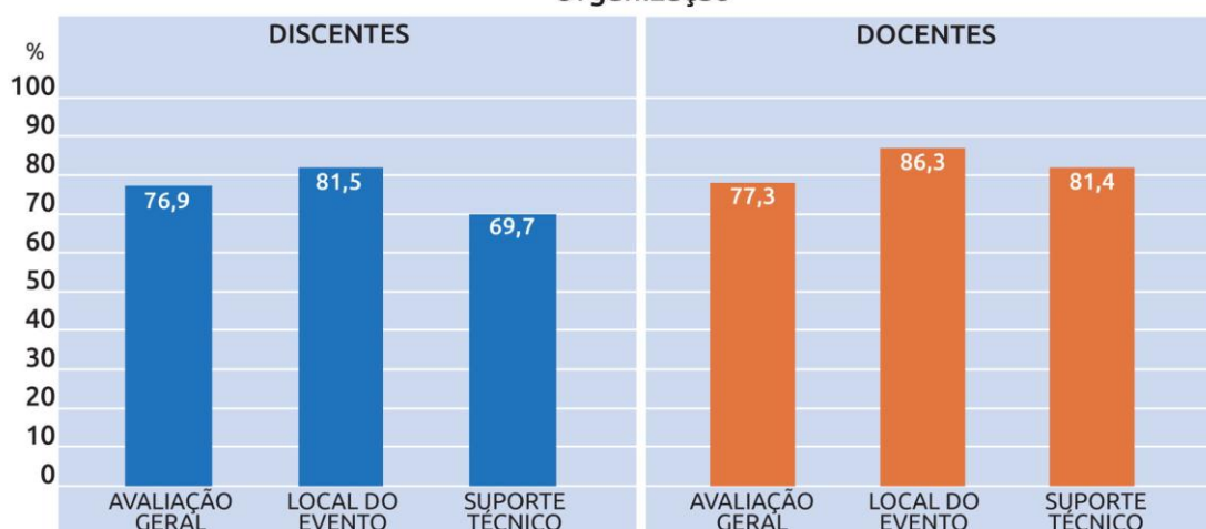
Gráfico 1 - Percentual de avaliações positivas (Bom/Muito bom) na dimensão “Organização”

A partir dos resultados demonstrados no gráfico 1 percebe-se uma avaliação positiva nas questões pontuadas sobre a dimensão “ organização do evento ”, possuindo, em média, 79% de resultados considerados “bom” ou “muito bom”. Outras duas questões avaliadas, no entanto, apenas entre os discentes, também mostrou tendência positiva para a duração (72,3%) e divulgação do evento (66,5%) (dados não apresentados no gráfico).